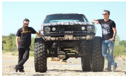
Fast 'N Loud