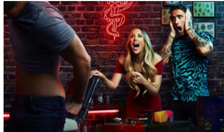
Just Tattoo of us