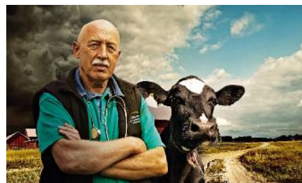
The Incredible Dr. Pol