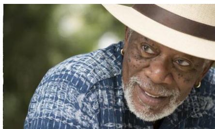
Story Of Us