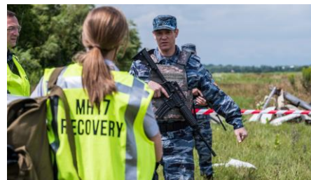
Air Crash Investigation