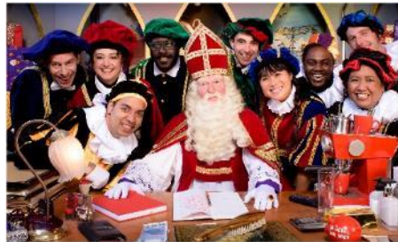
Op Weg Naar Pakjesavond