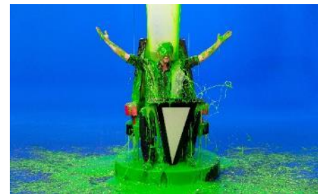
Kids Choice Awards