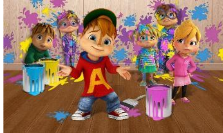
ALVIN!!! En de Chipmunks