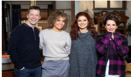
Will and Grace