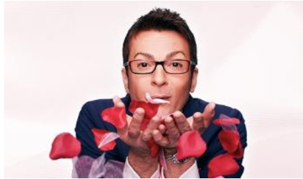
Say Yes To The Dress